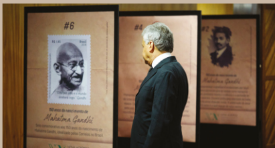
Exposição sobre a vida de Gandhi / Brasília-DF