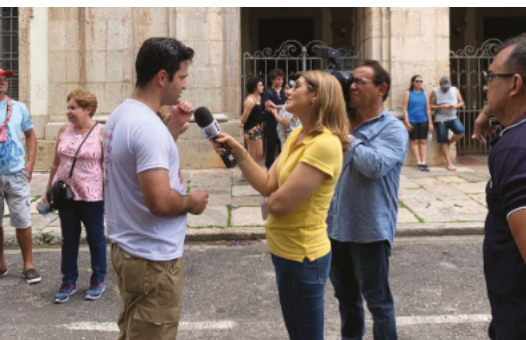
Entrevista / Belém-PA

Nova Acrópole publica, periodicamente, artigos em jornais e revistas e concede entrevistas em rádios e TV sobre temas filosóficos.