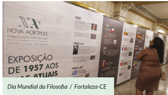
Dia Mundial da Filosofia / Fortaleza-CE

Em 2019, a temática foi: 'Os ideais do Renascimento: em celebração aos 500 anos de Leonardo da Vinci'. A celebração teve o apoio de inúmeros parceiros em todo o país. Foram realizados 39 eventos culturais em torno do tema em 20 diferentes cidades.