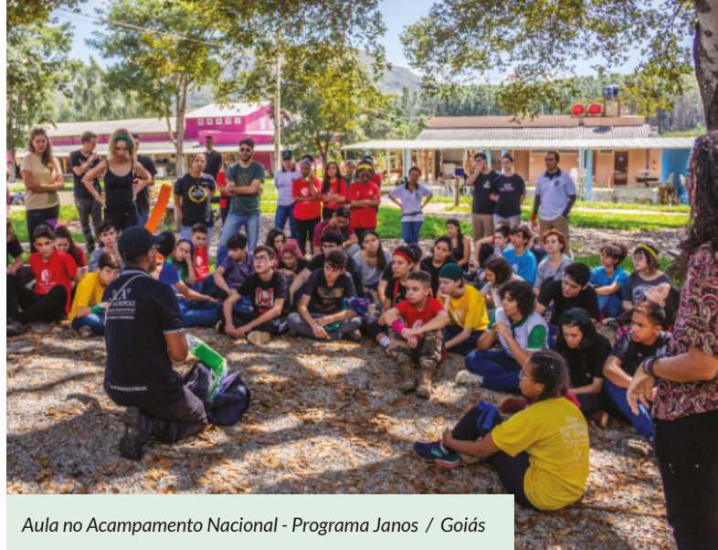
Aula no Acampamento Nacional - Programa Janos / Goiás

A dinâmica se dá através de aulas de filosofia, acampamentos nacionais e oficinas diversas como dança, teatro, esportes e tem como finalidade mostrar aos jovens como os conceitos teóricos podem ser aplicados na vida de forma objetiva.