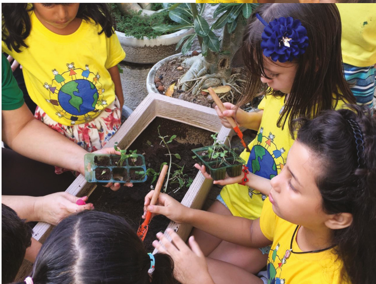
Aula de plantio de mudas para crianças - Programa Távolas / Natal-RN