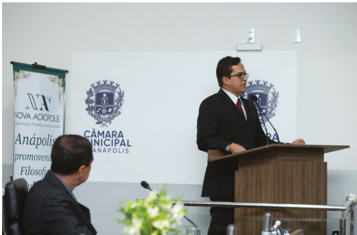
Sessão Solene / Anápolis-GO

Em 2019 a Câmara Municipal conferiu à Nova Acrópole Anápolis uma homenagem aos 18 anos de Filosofia, Cultura e Voluntariado na cidade, realizada em uma sessão solene no dia 22 de agosto. Na ocasião, alguns dos membros mais antigos foram homenageados pelos seus valorosos trabalhos em prol da cidade.