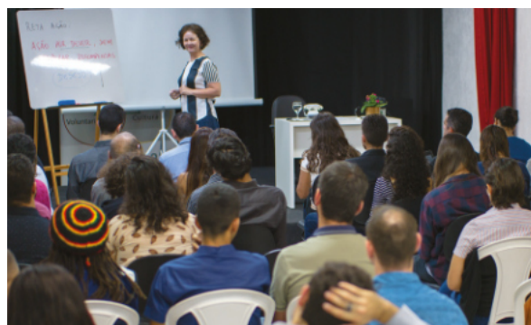
Aula especial sobre sentido de dever / Anápolis-GO