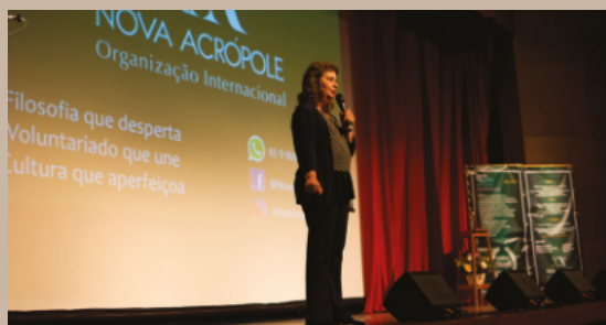
Palestra / Cuiabá-MT

No Rio de Janeiro, 130 pessoas participaram de palestra realizada com o Consulado da Índia naquela cidade, além de eventos em Natal e Teresina com repercussão na imprensa local.