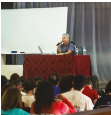
Curso de Integração / Brasília-DF

Os cursos especiais aprofundam a formação dos alunos do curso de filosofia em temas específicos.