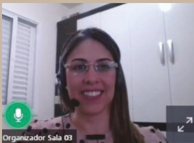
Organizador Sala 03