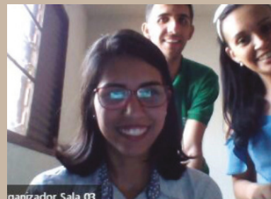
Organizador Sala 03