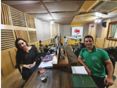
Participações / Belém-PA