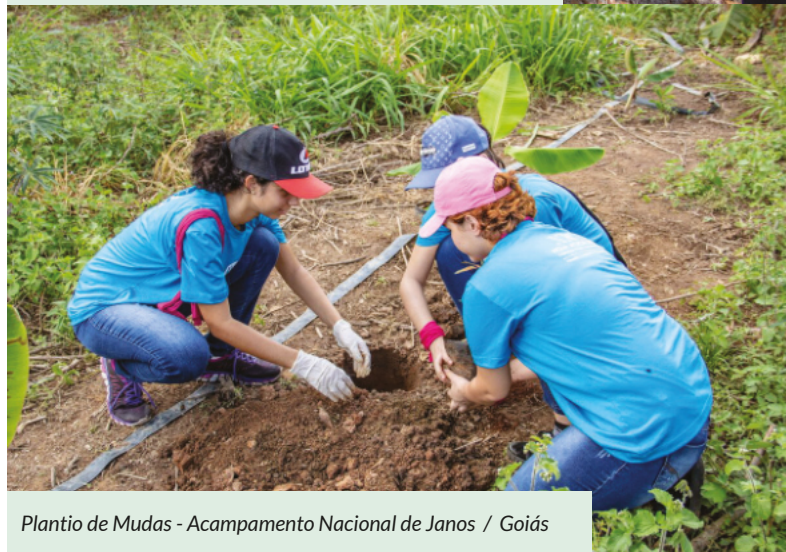
Plantio de Mudas - Acampamento Nacional de Janos / Goiás