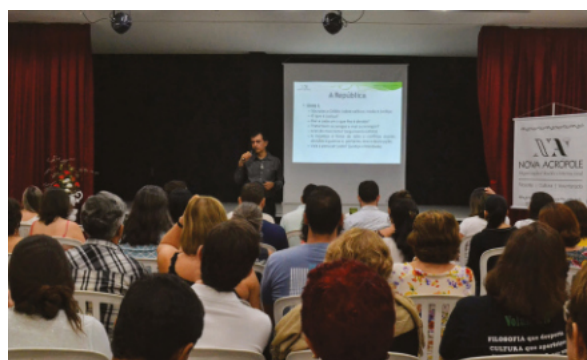
Aula sobre A República de Platão - Sede Nacional / Brasília-DF

Oferecemos palestras abertas e gratuitas sobre os mais variados temas filosóficos e culturais em todas as nossas sedes de forma regular.