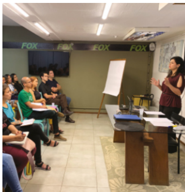
Curso sobre Apreciação Artística. Belém-PA

Cursos de formação pessoal Cursos de oratória, organização e com temas culturais diversos complementam a formação filosófica.