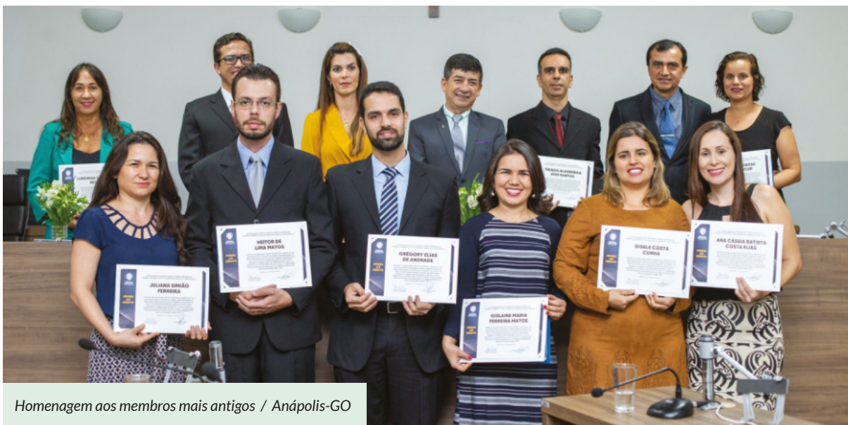
Homenagem aos membros mais antigos / Anápolis-GO

Com este status , Nova Acrópole pode ser consultada pelo órgão, participar de conferências das Nações Unidas neste tema e dar a sua contribuição.