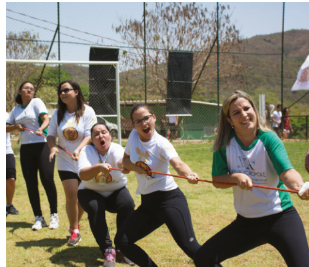
Cabo de Guerra- Jogos da Primavera