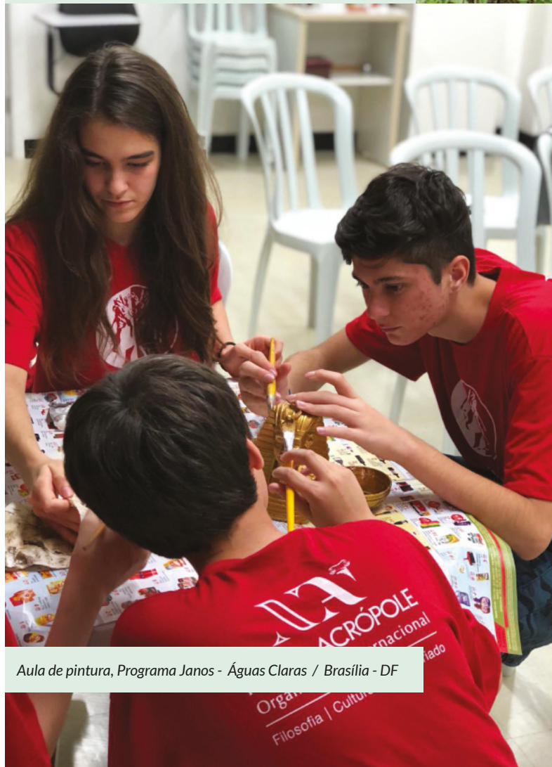
Aula de pintura, Programa Janos - Águas Claras / Brasília - DF