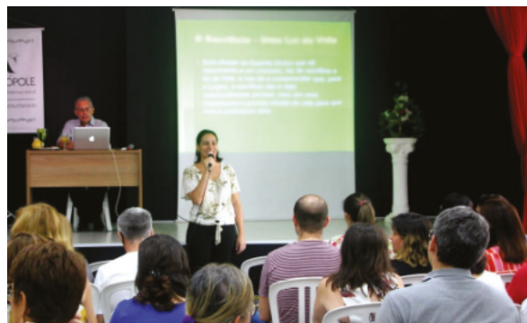
Curso especial sobre Leis da Natureza / Natal-RN