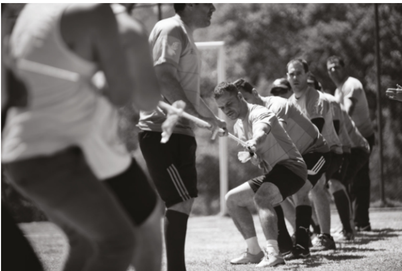
Cabo de Guerra- Jogos da Primavera