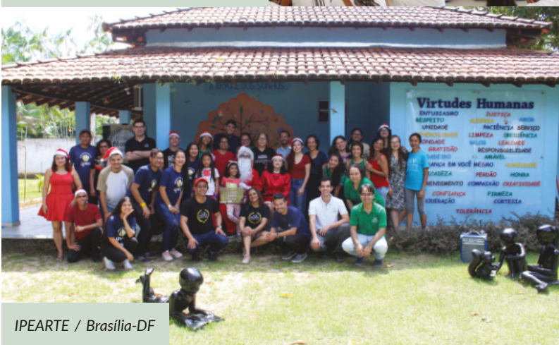
IPEARTE / Brasília-DF

Nova Acrópole apoia ainda o Instituto Paraense de Educação e Arte – IPEARTE no Município de Marituba, PA que atende a 100 crianças de 07 a 14 anos com reforço pedagógico, inglês, música, ballet, canto, arte e oficinas.