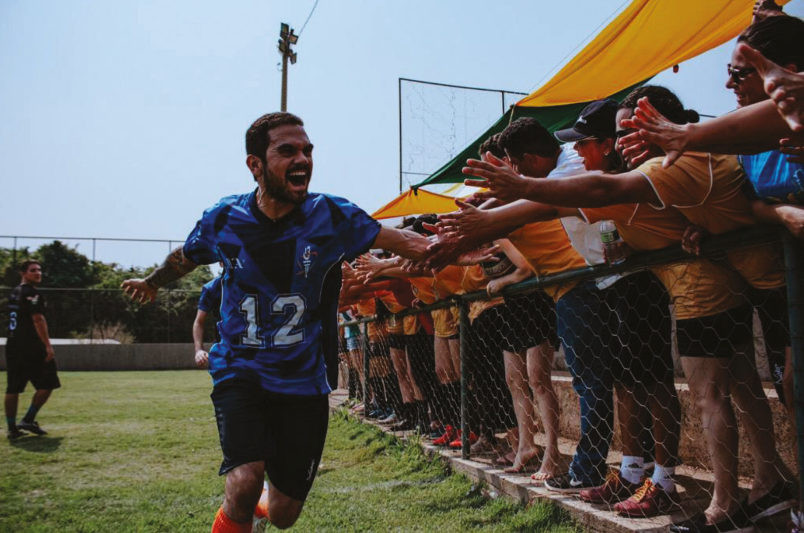
Jogos da Primavera