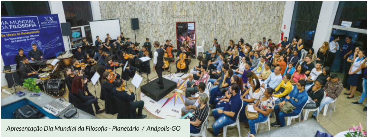
Apresentação Dia Mundial da Filosofia - Planetário / Anápolis-GO

Todos os anos, celebramos o Dia Mundial da Filosofia que foi instituído pela UNESCO em 2005, com atividades em todas as nossas sedes no País.