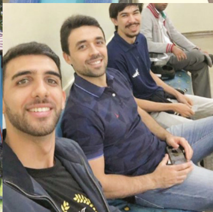
Ação de doação de sangue / Rio Verde - GO