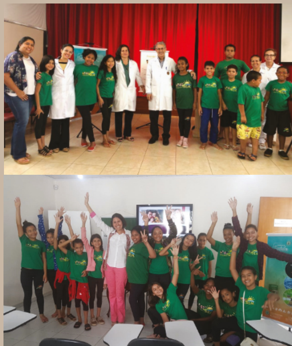
Profissionais do Seraphis com as crianças do programa Crianças para o Bem.

O Instituto Médico Seraphis oferece assistência médica ao projeto Crianças para o Bem e é parceiro para a promoção da saúde entre os membros de Nova Acrópole.