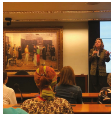
Palestra sobre Arte de Viver - Câmara dos Deputados / Brasília-DF

Oferecemos palestras em órgãos públicos, escolas, associações, fundações e várias outras instituições, sempre com temas filosóficos.