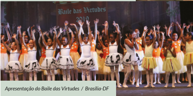
Apresentação do Baile das Virtudes / Brasília-DF