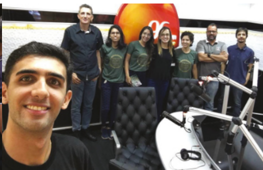
Entrevista / Rio Verde-GO