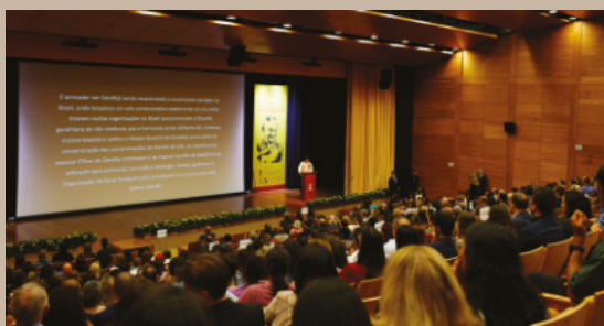
Palestra Teatro Pouplex / Brasília-DF