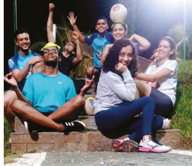
Treino Escola de Esporte / Anápolis-GO