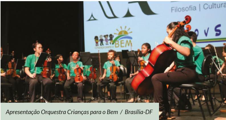
Apresentação Orquestra Crianças para o Bem / Brasília-DF