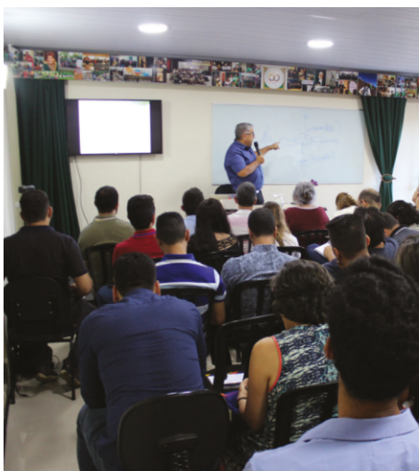
Aula especial / Taguatinga-DF

Além disso, o curso oferece práticas de psicologia para desenvolvimento de atenção, memória, imaginação e outras faculdades humanas.