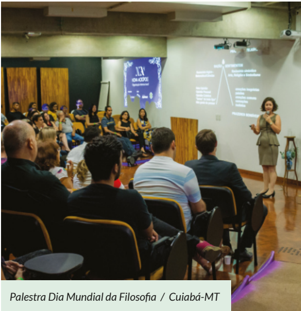
Palestra Dia Mundial da Filosofia / Cuiabá-MT

A data é celebrada na terceira quinta-feira do mês de novembro e busca valorizar o papel da filosofia para o desenvolvimento do pensamento, das atitudes e das relações humanas.