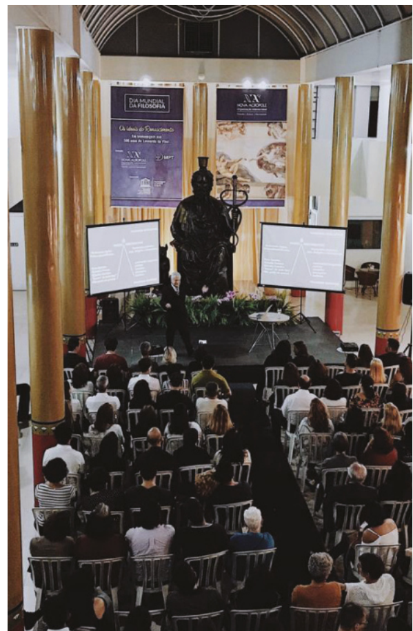
Palestra Dia Mundial da Filosofia / Brasília-DF