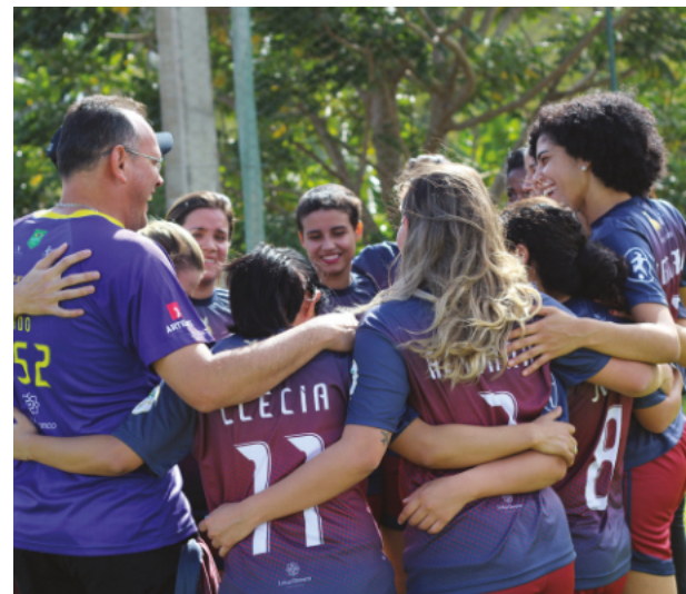
Celebração do time- Jogos da Primavera