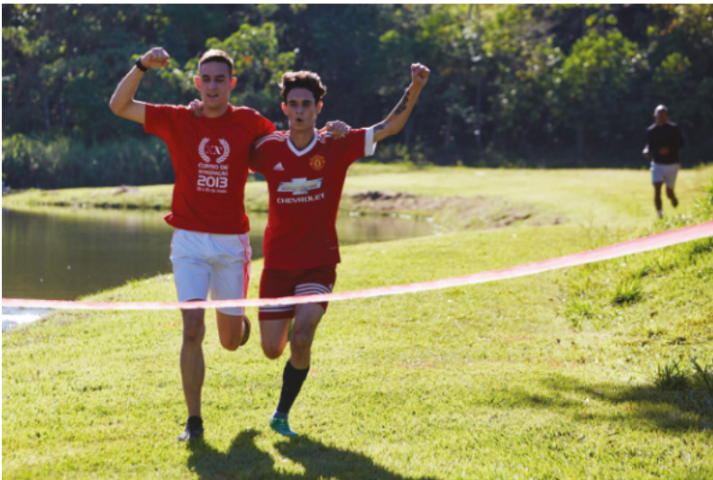
Corrida- Jogos da Primavera