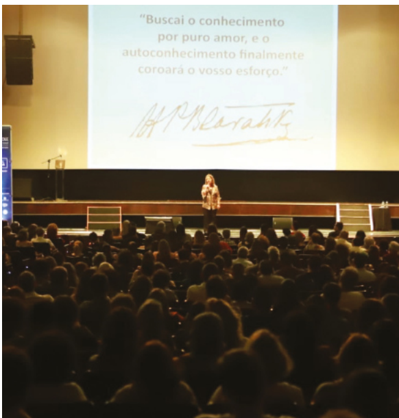
Palestra Dia Mundial da Filosofia / Fortaleza-CE

Todos os anos, celebramos o Dia Mundial da Filosofia que foi instituído pela UNESCO em 2005, com atividades em todas as nossas sedes no País.