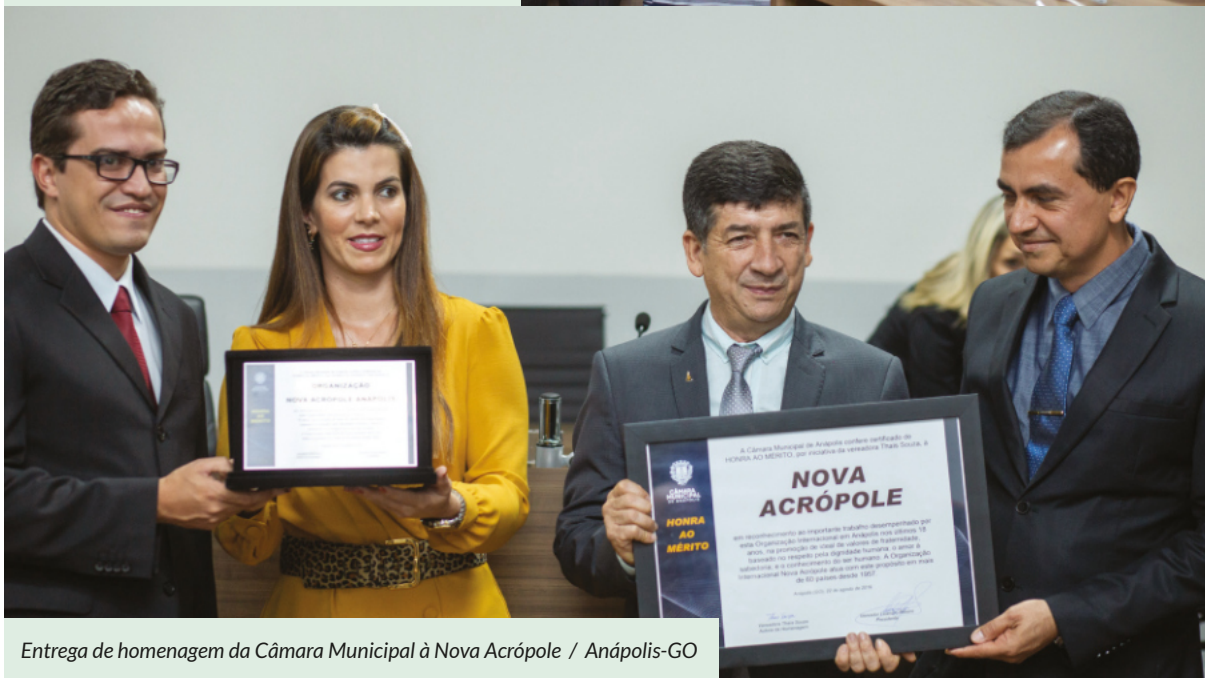
Entrega de homenagem da Câmara Municipal à Nova Acrópole / Anápolis-GO