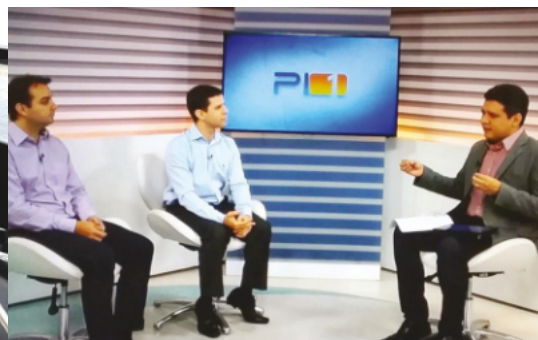
Entrevista / Teresina-PI

Em Belém, Nova Acrópole participa semanalmente no programa de rádio Conexão Cultura na Rádio Cultura.