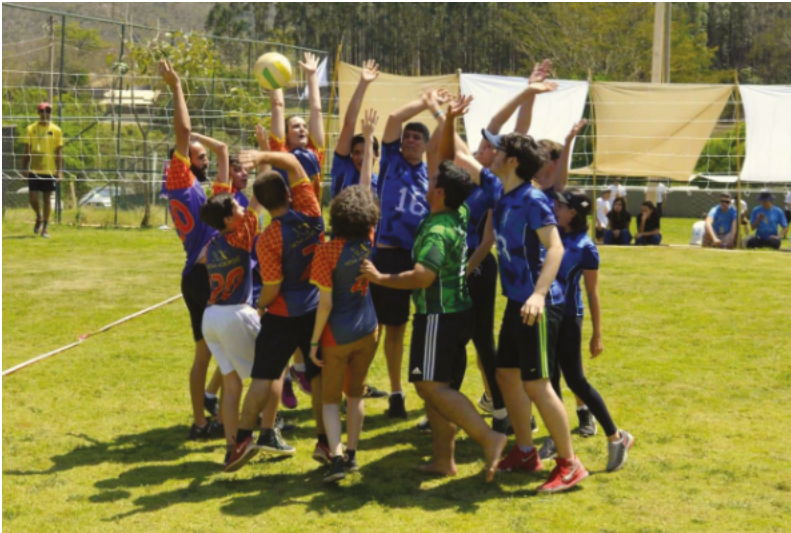
Vôlei - Jogos da Primavera