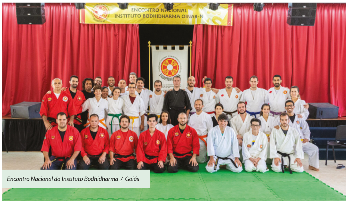
Encontro Nacional do Instituto Bodhidharma / Goiás

Já o Instituto Bodhidharma colabora com a formação dos membros de Nova Acrópole na área de artes marciais: Nei Kung, Iaido, Karatê e Tai Chi Chuan, entre outras modalidades.